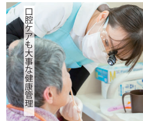
口腔ケアも大事な健康管理

健康、元気で長生きを目指しましょう。 そのために、私たちは日々の予防医療や リハビリで機能回復を実施しています。