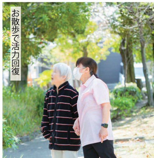
お散歩で活力回復