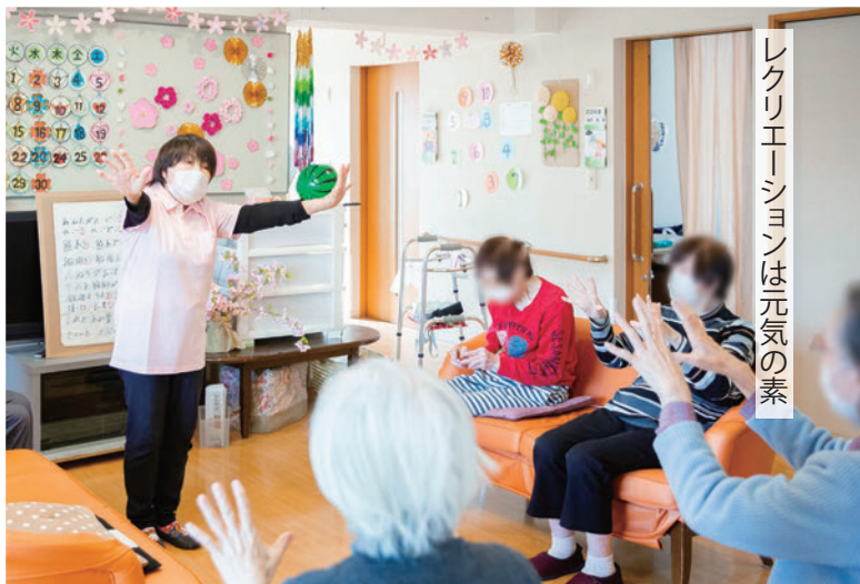
レクリエーションは元気の素