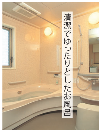
清潔でゆったりとしたお風呂