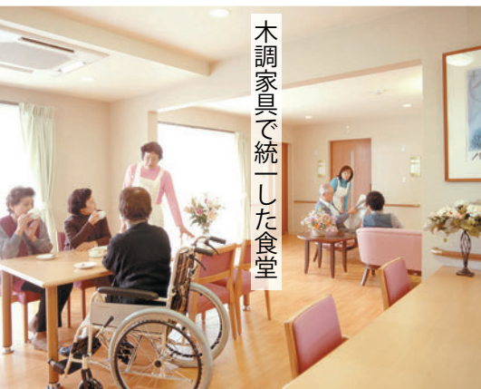
木調家具で統一した食堂