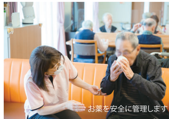
お薬を安全に管理します