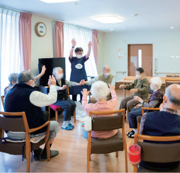
健康維持を兼ねたレクリエーション