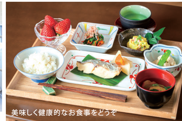
美味しく健康的なお食事をどうぞ