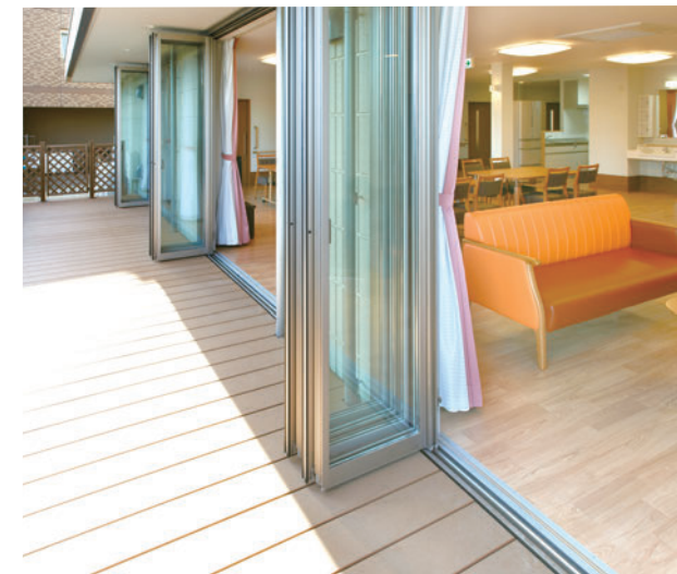
陽のひかり燦々ゆったりとしたテラス