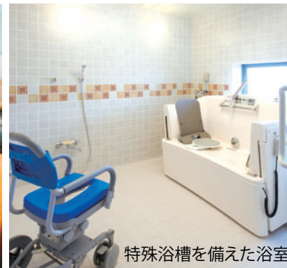
特殊浴槽を備えた浴室