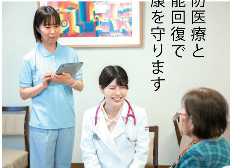
専門医による訪問診療

大病になる前の予防医療、リハビリでの機能回復を私たちは実施しています。グループ医療機関、桶狭間病院藤田こころケアセンターをはじめおけはざまクリニックからの訪問診療や定期的な診察で皆さまの健康をお守りしています。