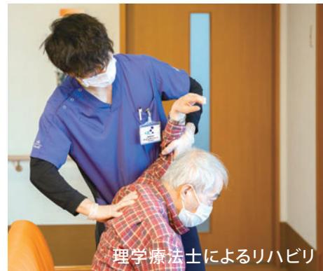
理学療法士によるリハビリ

Ｅテレで虹色紹介 レビー小体型認知症シンポジウムで 困難事例を数多く受け入れている その優れた対応事例として虹色を ご紹介いただきました