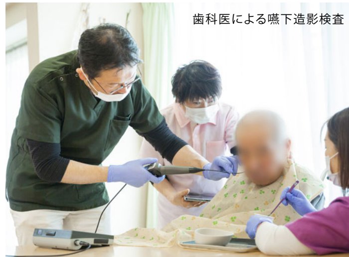
歯科医による嚥下造影検査