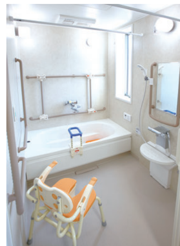
快適・安全な浴室