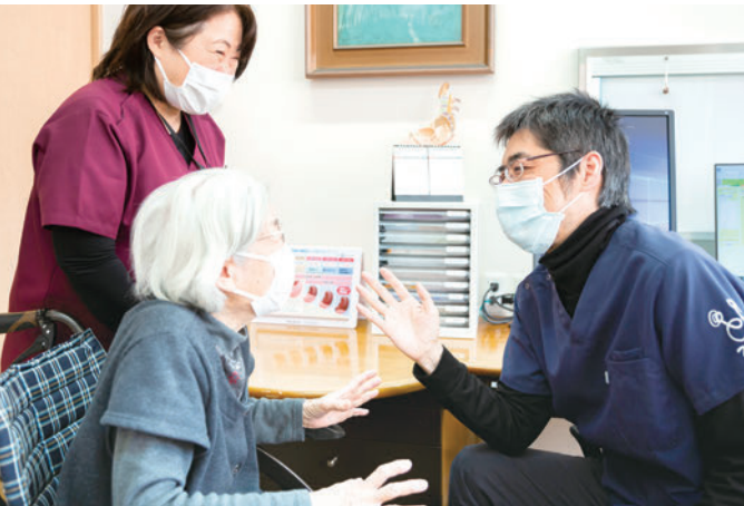
いつもの先生で安心診察