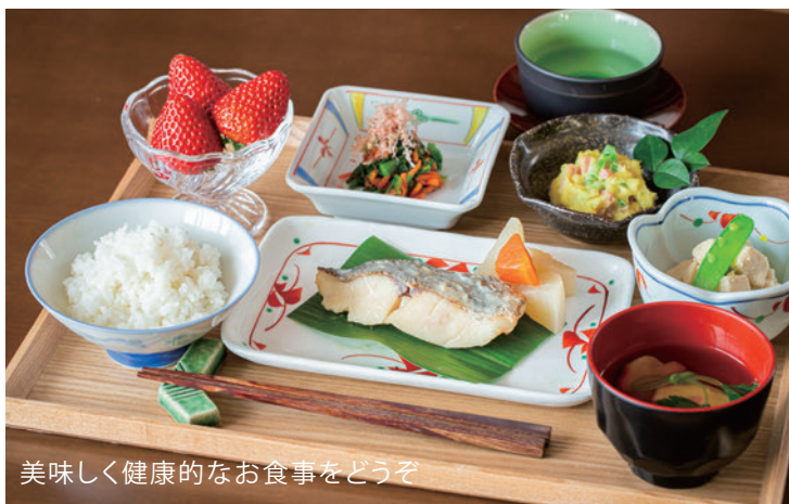
美味しく健康なお食事をどうぞ