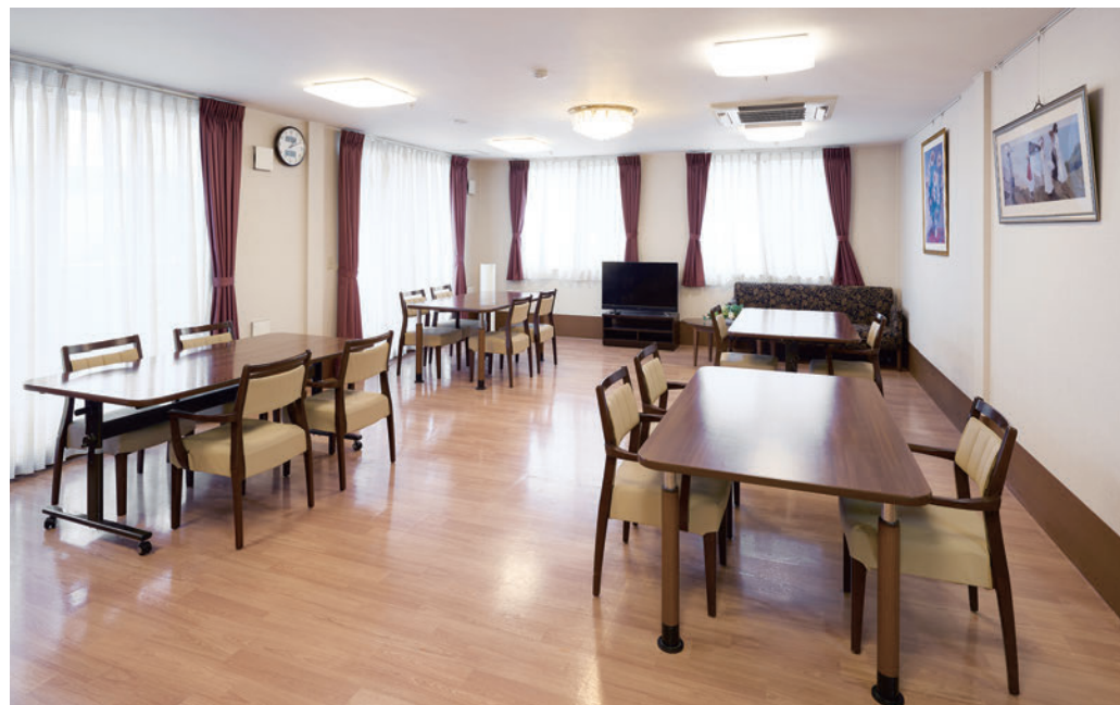
明るく広々としたリビング