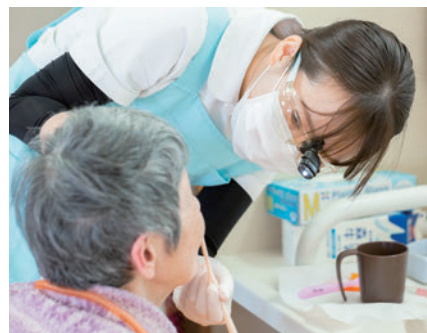
口腔ケアは健康のもと

大病になる前の予防医療と リハビリなどで機能回復を 実施しています。 グループ医療機関 おけはざまクリニックや提携している 歯科クリニックには 定期的な診察や訪問診療を お願いしています。