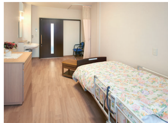
居室※ポータブルトイレやお花は設置例です